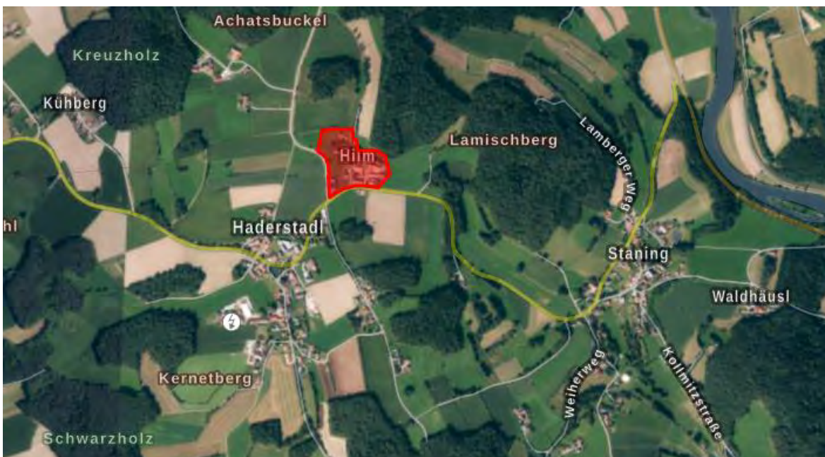
Abbildung 1: Übersichts-Lageplan (maßstabslos; Plangebiet markiert)

Beim Planungsgebiet handelt es sich um landwirtschaftlich genutztes Grünland, sowie um bestehende Bebauung.