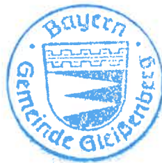
Wolfgang Daschner, 1. Bürgermeister