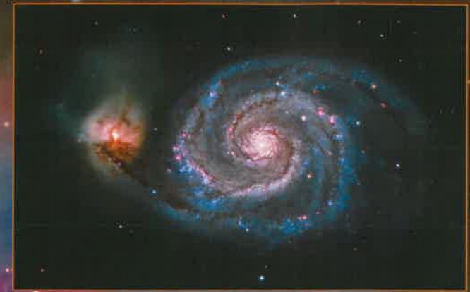
Whirlpool-Galaxie M51, Spiralgalaxie im Sternbild Jagdhunde