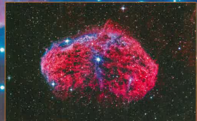
Sichelnebel NGC 6888, Emissionsnebel im Sternbild Schwan