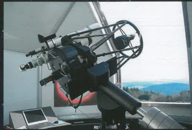
Das Prunkstück unserer Sternwarte: Teleskop Alluna Optics Ritchey-Chrétien, 20" Öffnung, f8 • Montierung: 10 Micron GM 4000 HPS