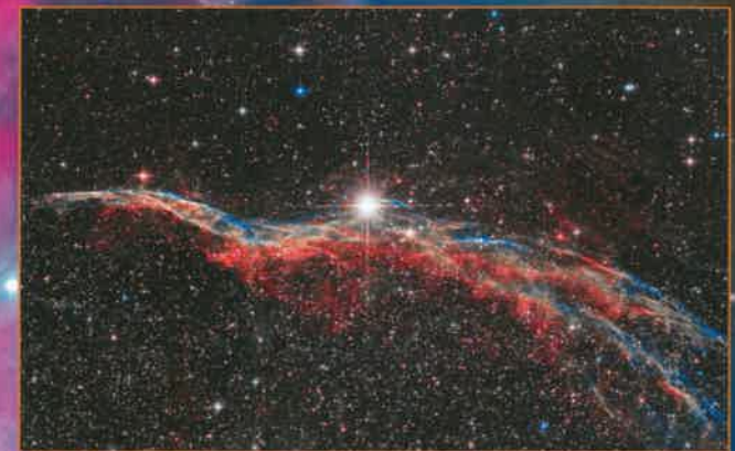
Sturmvogel, Teil des Cirrusnebels NGC 6960 in Cygnus (Schwan)