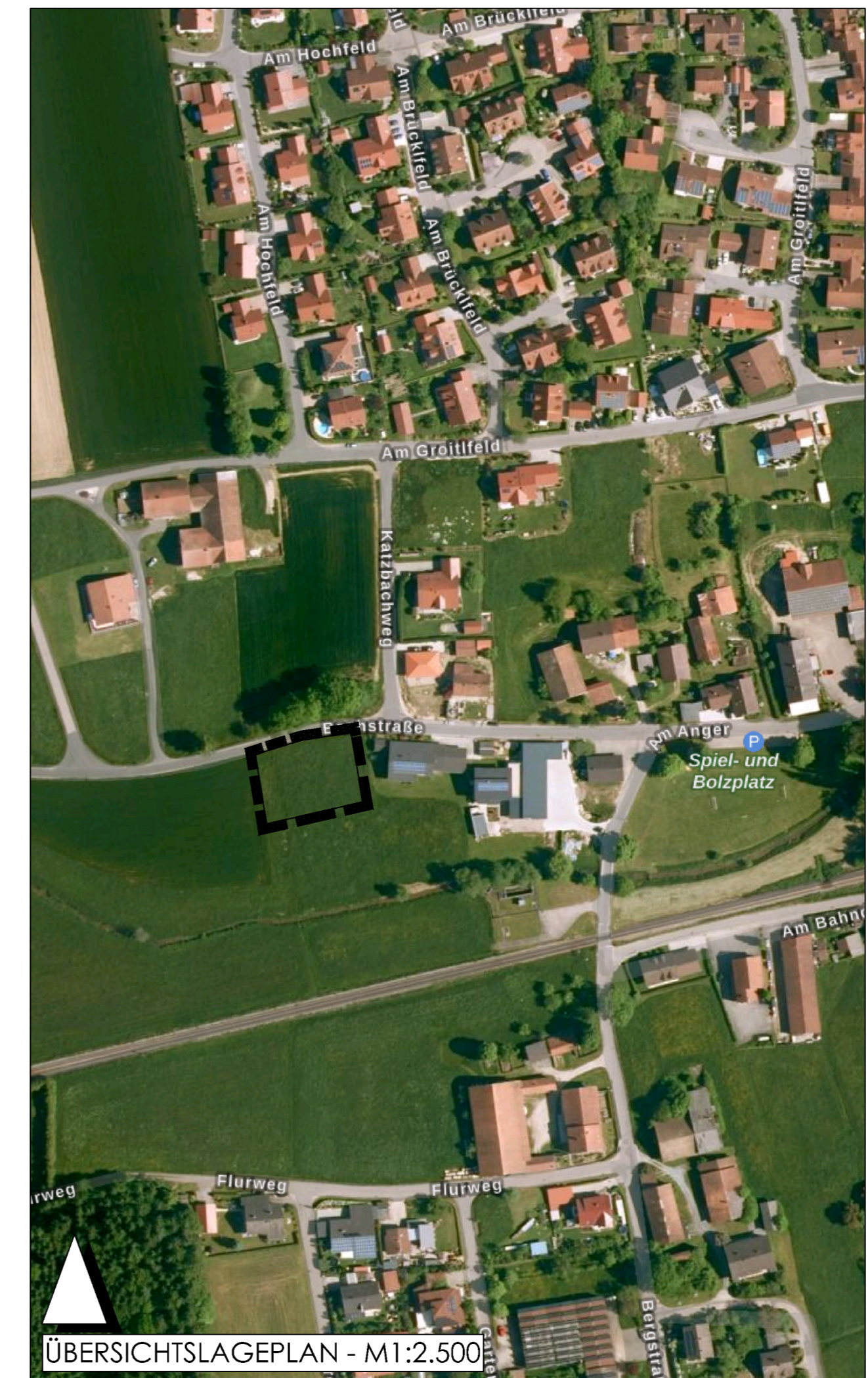
ÜBERSICHTSLAGEPLAN - M 1:2.500