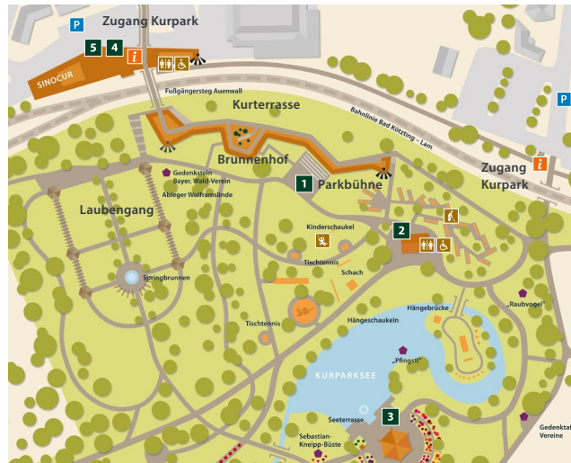
Gestaltung: LABOR 2 - Designagentur | Christian Vill | Bad Kötzing